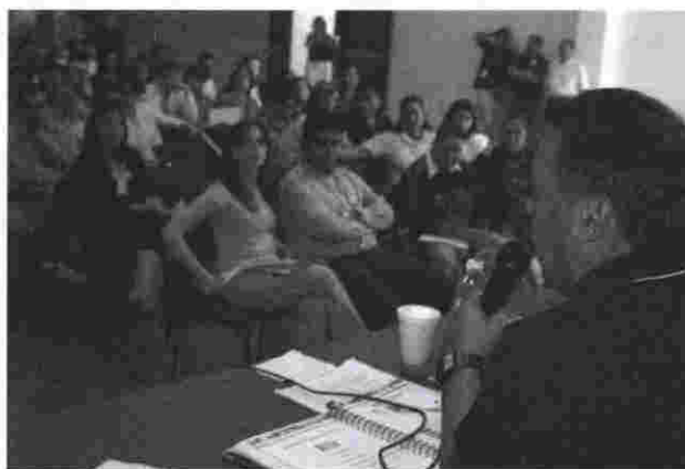
La Junta Ejecutiva impartió curso a los integrantes de los Consejos Electorales

Ya trabajada la propuesta de integración, se procedió a presentarla a la Comisión de Organización y Partidos Políticos y ésta, a su vez, ante el Consejo General en sesión extraordinaria del día 15 de enero del 2004, en la cual se aprobó la integración de los 18 Consejos Distritales y los 57 Consejos Municipales Electorales.